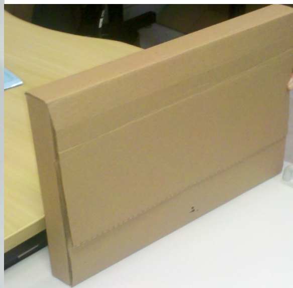
FIGURA 02C - COMPRIMENTO: 38CM