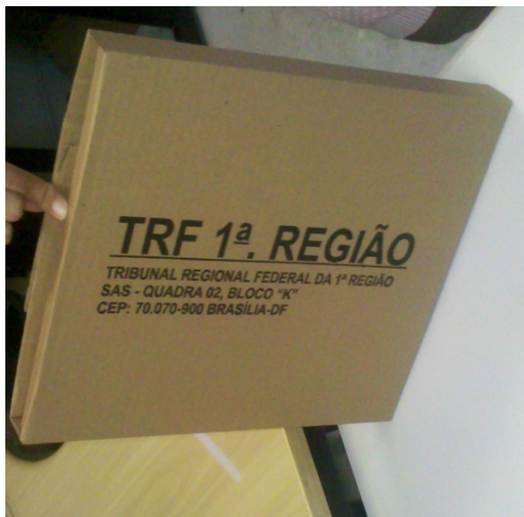
FIGURA 02B - LARGURA: 30CM