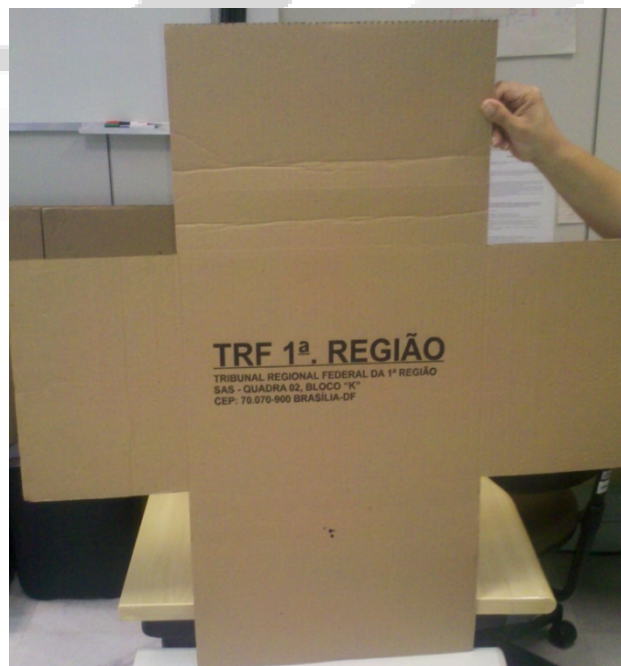
FIGURA 02A: VISTAS CAIXA FECHADA FRENTE E VERSO